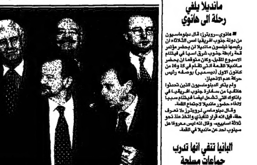
وزراء خارجية حلف الناتو لدى اجتماعهم في بروكسل

واشنطن - قالت صحيفة «نيويورك تايمز» إن الدول الـ15 توافق على خطة القومية الأوروبية لتوسيع الاتحاد.